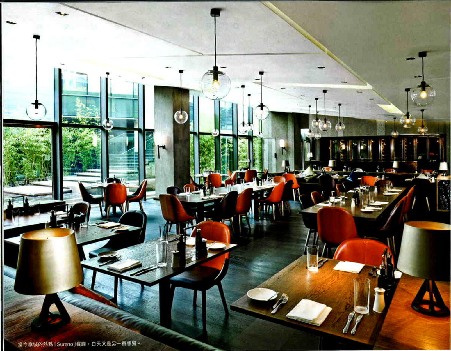
當今京城熱點「Sureno」餐廳，白天又是另一番感覺。