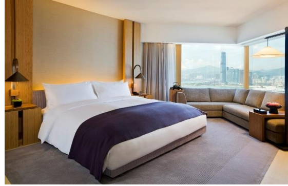
Studio 70 海景