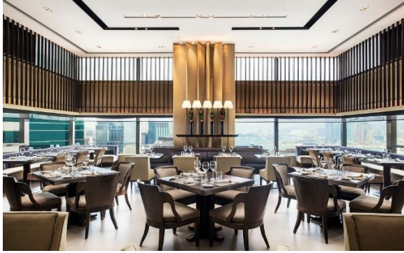
Cafe Gray Deluxe