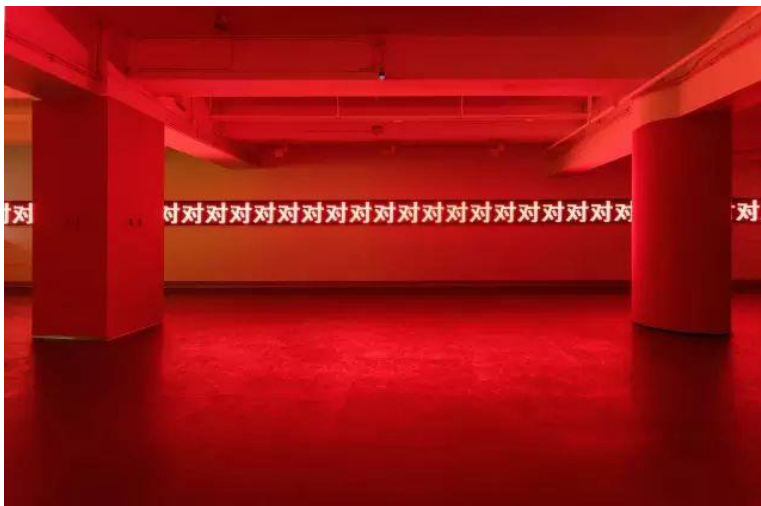
睢安奇·《對對對對對》·裝置 (LED 燈箱監視器影像)·2017。圖片：致謝麓湖·A4 美術館

2017 年成都 A4 美術館開幕展上展出的相同媒介作品《對對對對對》形成了有趣的銜接。