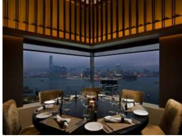
Café Gray Deluxe