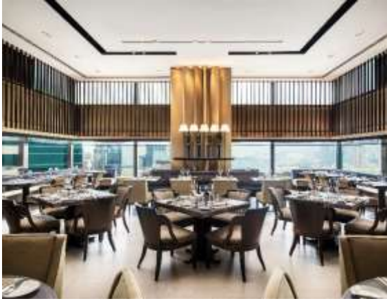
Café Gray Deluxe