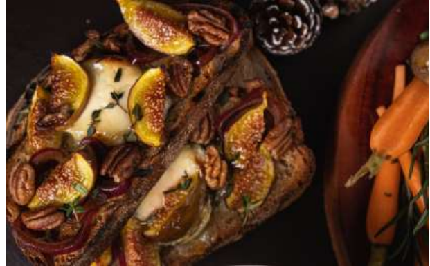
C'est Cheese - 山羊芝士多士