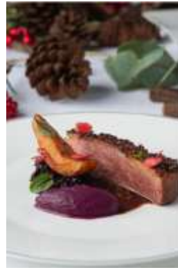
圣诞节庆套餐 - 香煎鸭胸