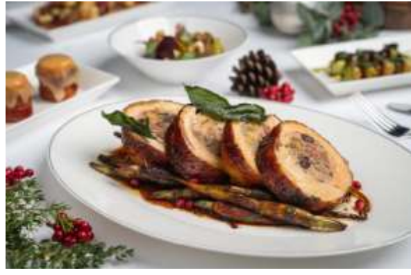
分享盛宴 - 火鸡卷