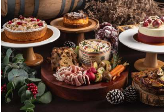
C'est Cheese – 节日美点