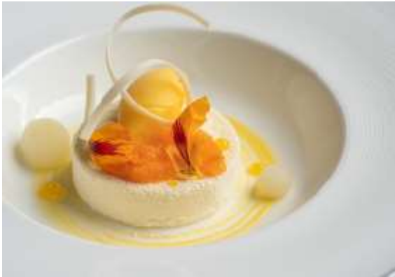
除夕晚餐 - 酒香杏仁冰淇淋蛋糕