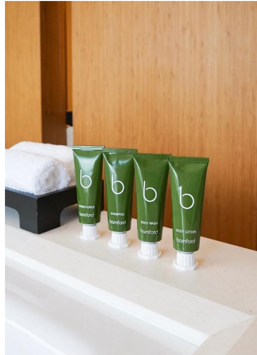
奕居的 Bamford 鋁管