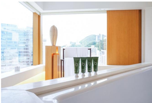
奕居的 Bamford 鋁管