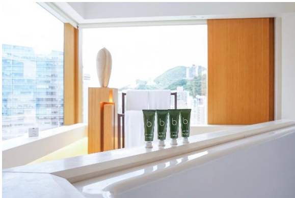
奕居的 Bamford 铝管