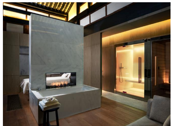
成都博舍 - 謐尋水療中心VIP理療室