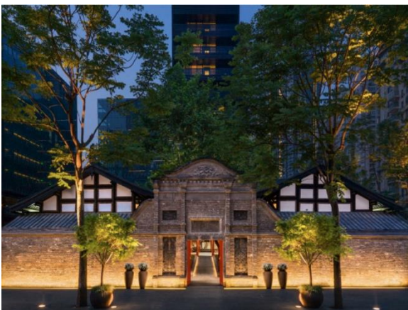
成都博舍 - 酒店外觀