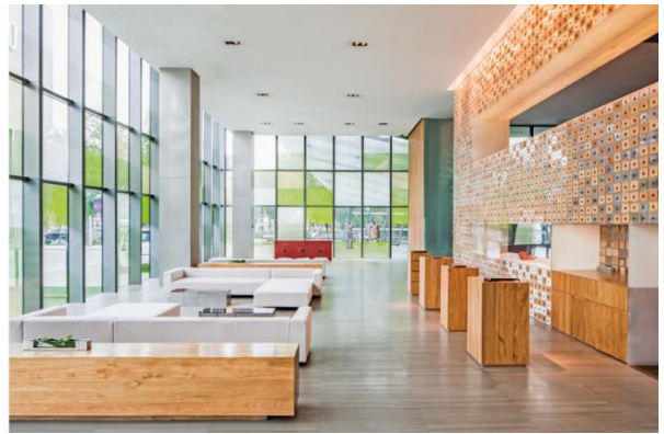
北京瑜舍 - 酒店大堂