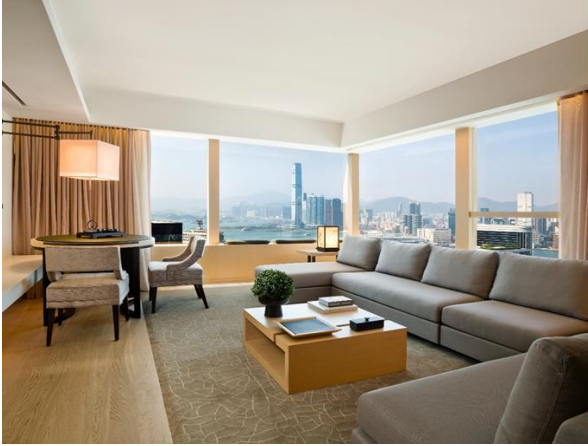
香港奕居 - 奕居套房