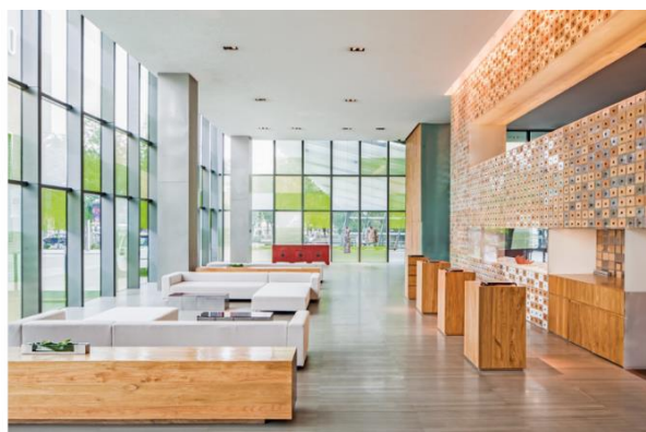
北京瑜舍 - 酒店大堂