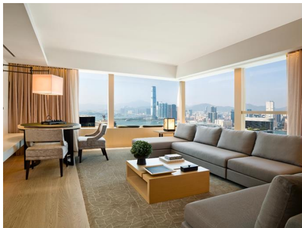
香港奕居 - 奕居套房