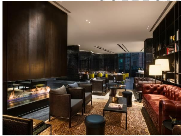
Café Gray Deluxe 酒廊