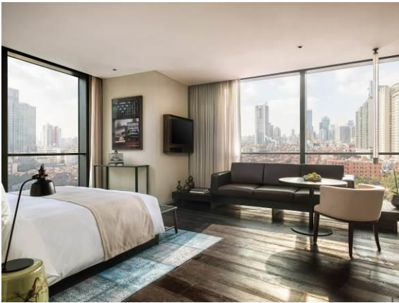
鑛舍 Studio 70