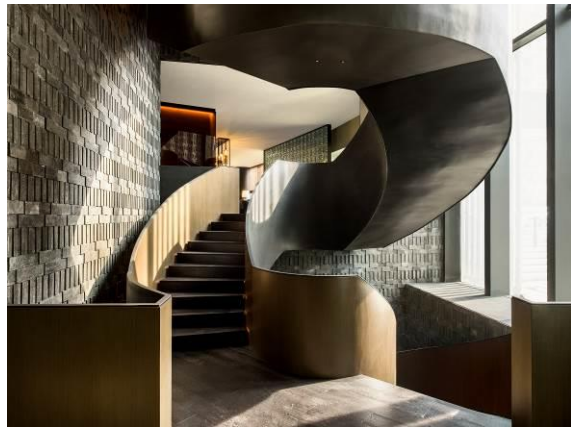
鑪舍公寓式酒店旋轉樓梯