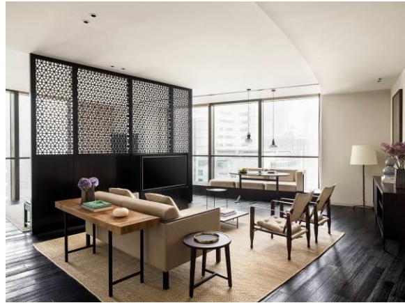
鑛舍公寓式酒店 Residence 90