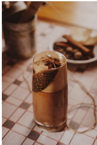
Yuen Yeung (鴛鴦)