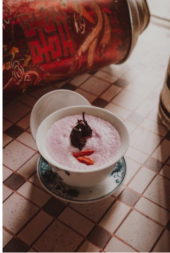
Jaa Sei Mei (廿四味)