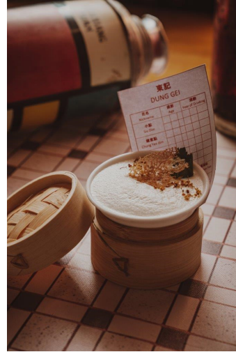
Yum Cha (飲茶)