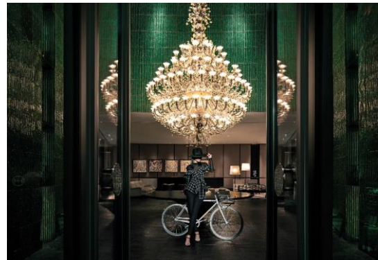
上海鑄舍 — 時尚社論