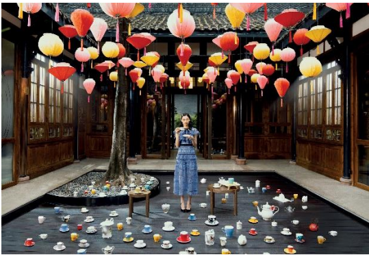
成都博舍 — 奇思妙想