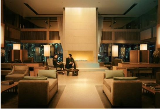
香港奕居 — 靜謐秘境