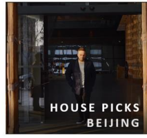
「House Picks」 影片系列