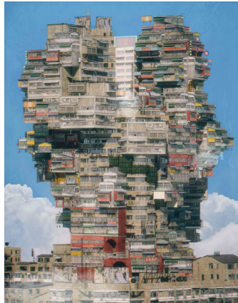
One Island South