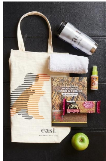
香港東隅徒步托特包