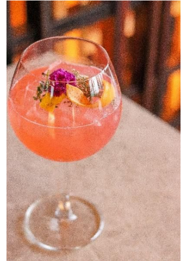
香港東隅Sugar酒吧提供低糖雞尾酒