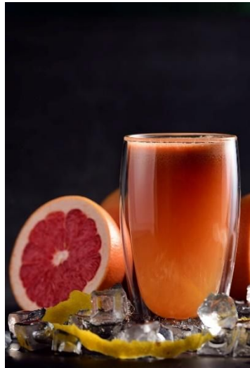
北京東隅Domain域提供鮮榨果汁