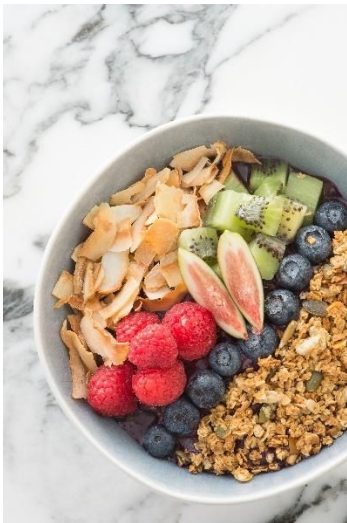
香港東隅FEAST提供巴西莓碗