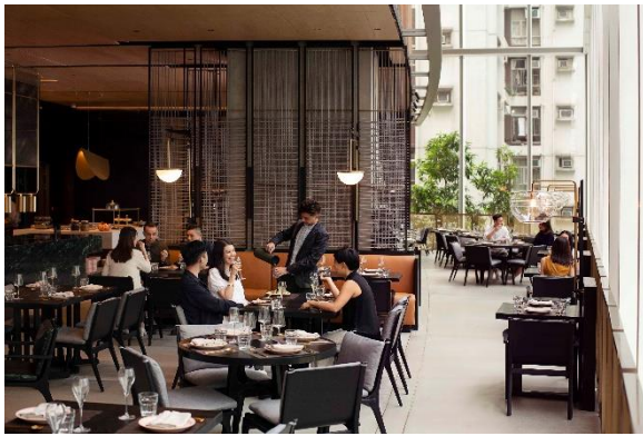
FEAST (Food by EAST)