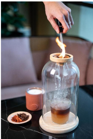
No.84 Cold Brew