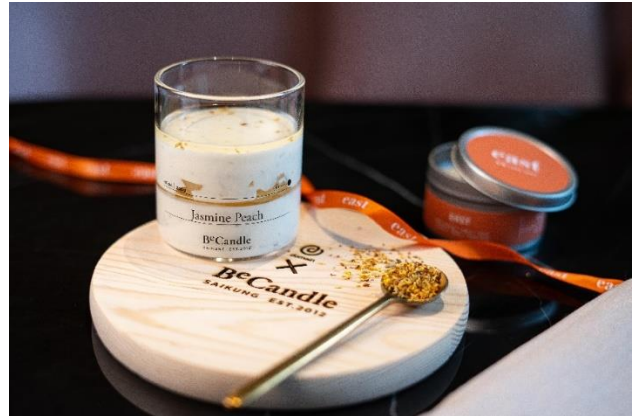
Jasmine Peach 意式奶冻