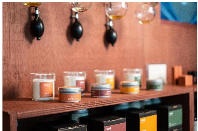
香港东隅香薰蜡烛