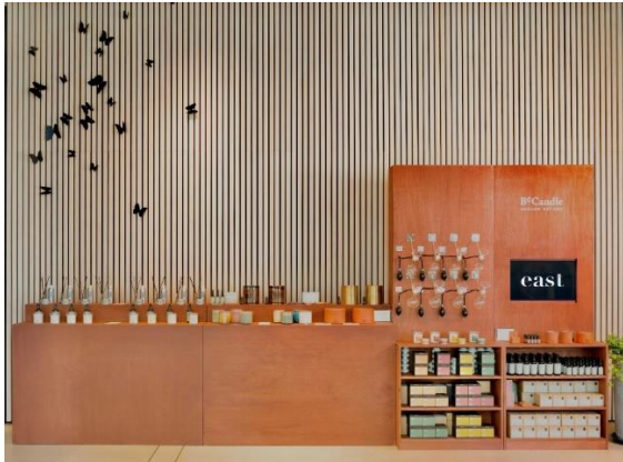
Domain x BeCandle 期间限定店