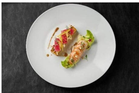
龙虾和吞拿鱼沙拉