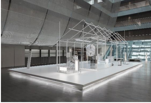
北京瑜舍 x RIMOWA “As Seen By 所見” 藝術巡展