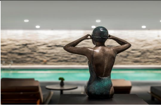
上海鑄舍謐尋水療中心「悅活」理念