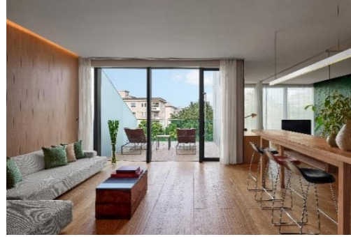
北京瑜舍藝享旅居住房禮遇