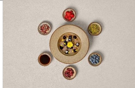
成都博舍夏季菜品