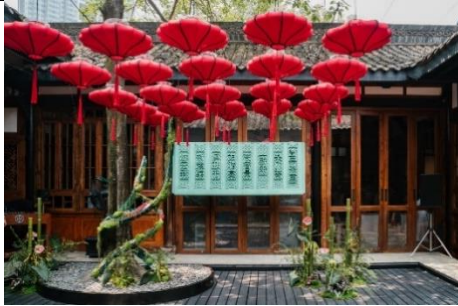
成都博舍米其林一星餐廳謐尋茶室