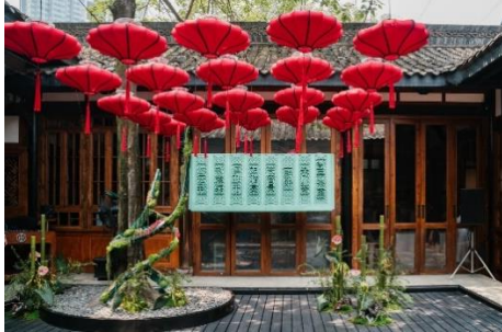
成都博舍米其林一星餐厅谧寻茶室