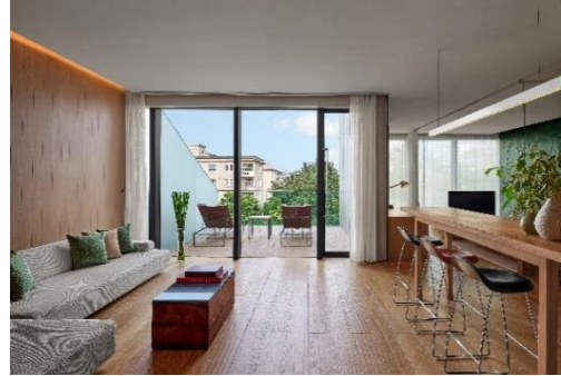
北京瑜舍艺享旅居住房礼遇