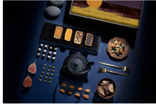
一盒內有八件裝迷你月餅，包括四款迷人口味