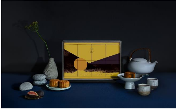
居舍系列月餅禮盒 — 包裝具現代風格及可持續性的設計