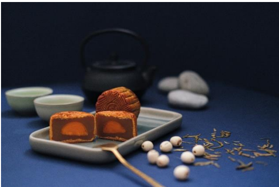
芽糖醇迷你蛋黃白蓮蓉月