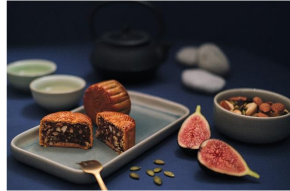
迷你無花果果仁月