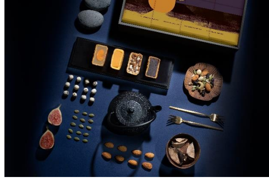
一盒内有八件装迷你月饼，包括四款迷人风味