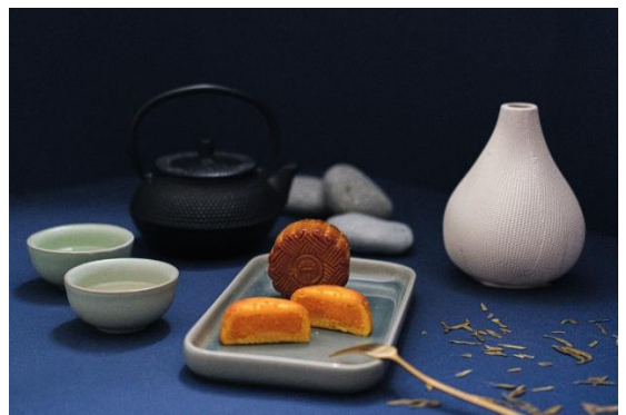
迷你蛋黄奶皇月饼