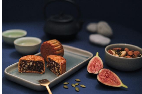
迷你无花果坚果仁月饼