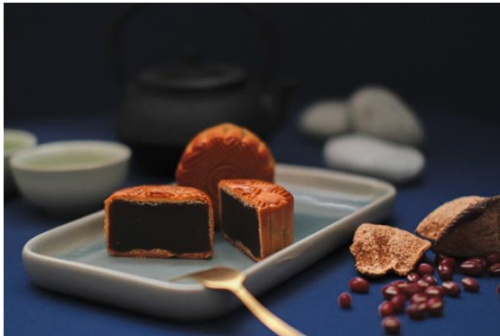
迷你陈皮红豆沙月饼